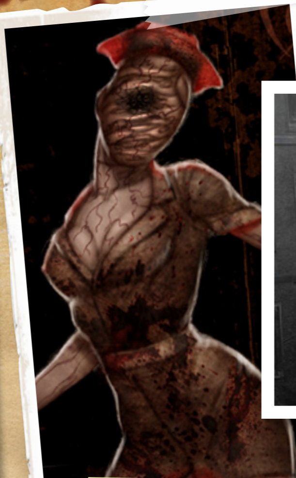
Quello di Alchemilla è uno dei due ospedali della città vicina di Silent Hill.