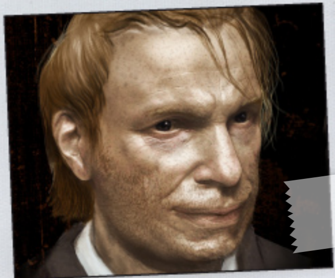
MAYOR SAM BARTLETT

Il nostro sindaco ama l'alcol più delle persone. I Bartlett hanno fondato Shepherd s Glen insieme al mio bis, bis, bisnonno.