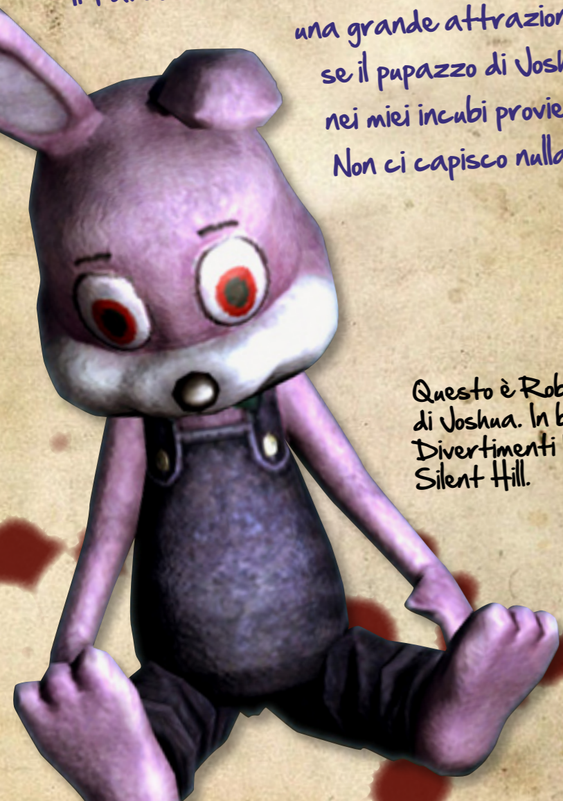
Questo è Robbie, il pupazzo di Joshua. In basso: Parco Divertimenti Lakeside, Silent Hill.

Il Parco di Divertimenti di Lakeside doveva essere una grande attrazione. Chissà se il pupazzo di Joshua che torna nei miei incubi proviene da lì? Non ci capisco nulla.